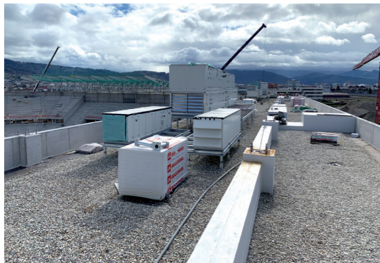
Übersicht vom Hauptgebäude, dessen Dach die Peter Gerber GmbH abgedichtet hat.